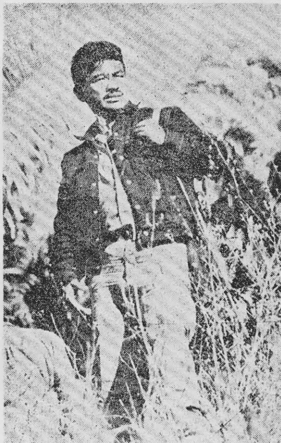
GENARO VASQUEZ ROJAS, fue maestro y guerrillero.

Cuando Genaro obtuvo su título de maestro, en 1950, ya tenía cuatro años en el gobierno de México el licenciado Miguel Alemán. Ya había pasado la represión del ejército contra los petroleros el 19 de diciembre de 1946 y el régimen había sometido y aplastado a los sindicatos industriales que buscaron una lucha unitaria. Habían sido ahorrados los petroleros, corrompiéndose toda su dirección; se había comprado a los líderes ferrocarrileros, interfiriendo la vida de su sindicato y encarcelando a sus anteriores dirigentes; se había aplastado a los trabajadores mineros en las huelgas de Palau, Rosita y Cloete y en su caravana que exigía el respeto a la democracia sindical y al derecho de huelga. Se había desplazado del sindicato de electricistas a los disidentes. Genaro Vázquez Rojas vivió esos días desde la banca estudiantil, contemplando la miseria de las ciudades perdidas en la Ciudad de México y el desprecio de las autoridades por los problemas de las grandes masas. La alta burocracia gubernamental se enriquecía y derrochaba fastuosamente el dinero mal habido; las fortunas de la camarilla alemanista dejaban pálidos a sus antecesores. El cinismo de la burguesía burocrática era insul-