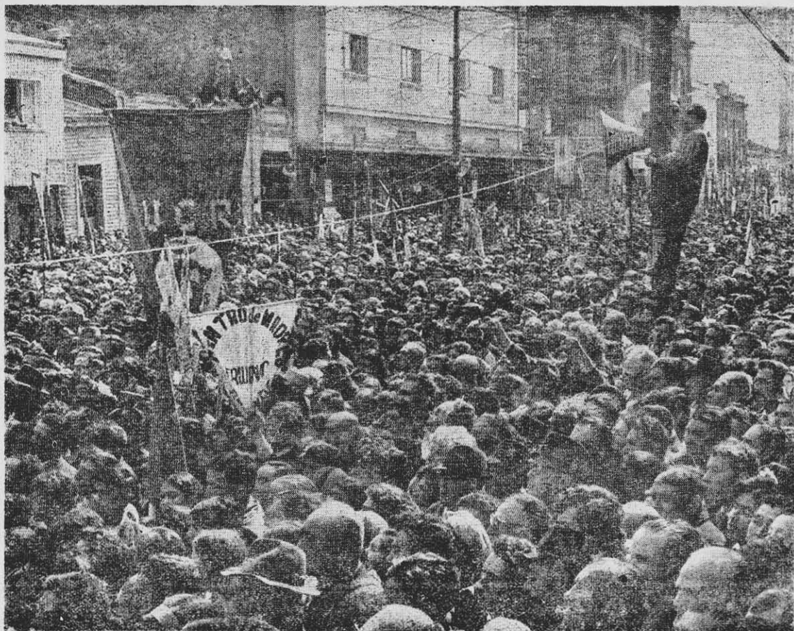
LA MOVILIZACION de masas con objetivos revolucionarios puede ganar a la clase media.