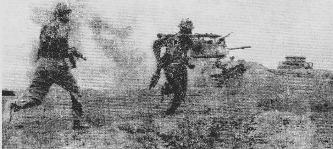
El MAPU señala que dos, tres, muchos Vietnam, terminarán con el imperialismo.