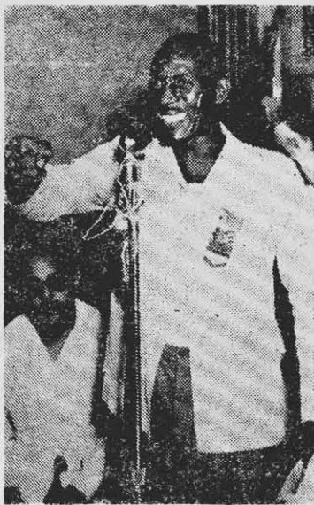
JESUS MENENDEZ, líder de los obreros azucareros, asesinado por su lealtad de clase.