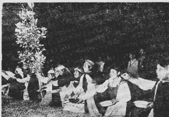
LOS MAPUCHES: explotados de la tierra.