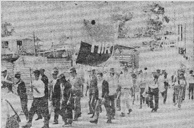
Los campesinos luchan por la tierra.

La burguesía terrateniente y comercial encastillada en Copiapó no tiene problemas para mantener su "status" y a la vez profundizar su organización y actividades contra el gobierno popular y los trabajadores. Entretanto, ahí están sin tocar