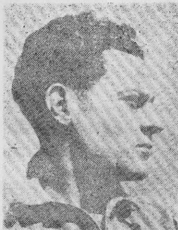
JULIO ANTONIO MELLA: fundador del PC cubano.

(El capital viene al mundo manando sangre y lodo por todos sus poros —decía Carlos Marx. Es la rapiña de los países coloniales, la expropiación de la propiedad agraria feudal, las guerras internacionales, el saqueo y el robo legalizado, lo que ha constituido la base —según el mismo Marx— de la acumulación capitalista actual). Esto es lo que se ha intentado hacer en México apoderándose de los bienes del clero y de algunos latifundistas. Pero estos bienes no bastan para hacer un capital que compita con el de los grandes industriales y banqueros extranjeros. No es posible "ahorrar" en México para hacer un gran capital, puesto que diariamente se está sufriendo la competencia de los productos ex-