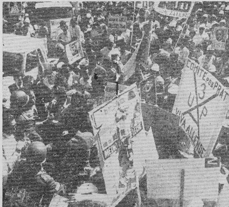
¿LA CLASE MEDIA apoya al proletariado en el proceso chileno?

A la primera pertenecen los artesanos, los productores de toda aquella industria típica nacional que aún surte a una gran parte de la población: alfarería, sarapes, talabartería, trabajo de ixtle. También podría considerarse como artesanos a muchos productores independientes, abastecedores de las necesidades comunes de las ciudades grandes, tales como sastres, zapateros, carpinteros y otros. Pero éstos, en una buena proporción, van dejando de pertenecer a la categoría expuesta y, por la adquisición de métodos modernos de producción, entran a la fase de miembros de la nueva economía con el carácter de pequenoburgués. Solamente se han citado en esta categoría, al hablar de una clase de transición,