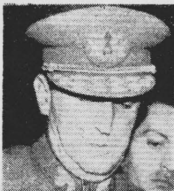
VIAUX: la baratura del asesinato político.