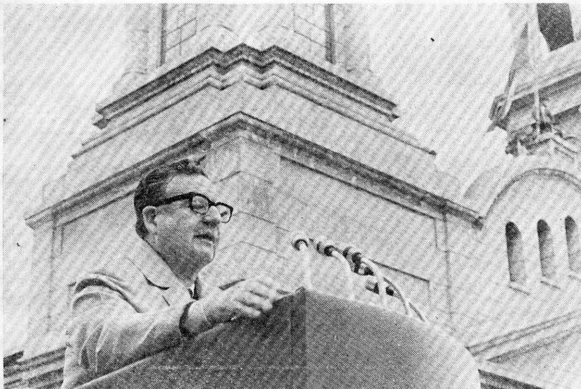
EL PRESIDENTE ALLENDE habla sobre la nacionalización del cobre en la Plaza de los Héroes, en Rancagua, el 11 de julio.