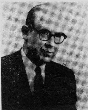
EDWARD KORRY: la marihuana la traen los yanquis.

das por el Servicio Nacional de Salud señalan que entre 1968 y 1969, el consumo de estupefacientes aumentó en un 60%. A raíz de ello se dictaron algunos decretos para fiscalizar su uso. El LSD, por ejemplo, fue limitado en agosto del 68 a fines médicos exclusivamente. Y desde marzo de este año rige un decreto que prohíbe la venta de anfetaminas, barbitúricos y tranquilizantes a todos los menores de 18 años.