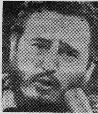
FIDEL CASTRO: una lección.

Ahora bien: los monopolios periodísticos de ese tipo no hacen más que desarrollar su verdadera naturaleza de defensores de un sistema imperialista. Pero resulta menos comprensible que la prensa no ligada a dicho sistema se permita minimizar y en oca-