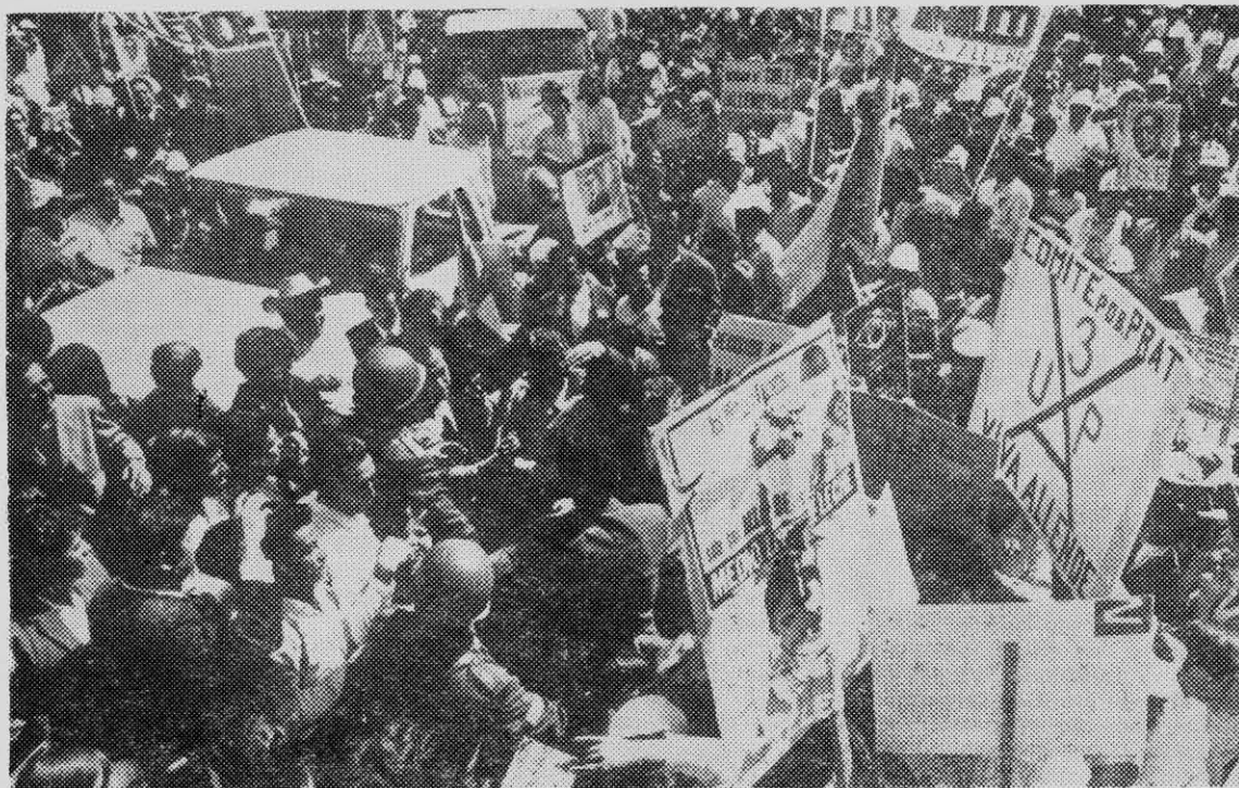
EL PUEBLO debe ejercer el Poder desde sus propias organizaciones de base. Para esto la organización revolucionaria y el combate contra el sectarismo son indispensables.

diario a convidar a la gente. Cuando se reunieron unas quince personas, él contó a todos la idea del diario, les pidió a los compañeros estudiantes que trataran de conseguirse un mimeógrafo manual, una cajita muy simple que él había conocido en su sindicato.