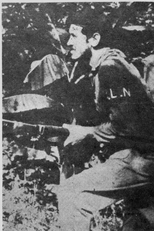
CAMILO TORRES: un ejemplo para los cristianos chilenos.

Como dice el teólogo cubano Sergio Arce: "la Iglesia no tiene derecho a hablar cuando la anima otro propósito que no sea el profético... la Iglesia y los cristianos que entiendan así su misión de testimonio y que luchan por mejorar esta sociedad socialista, y no destruirla, aportan su fuerza y elementos más positivos" (9).