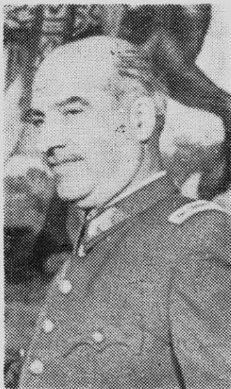
GENERAL RENE SCHNEIDER: atentado terrorista.

Algunos de esos jefes confidenciaron que en caso de fallar el terrorismo, viajarían a Argentina para fortalecer en ese país una infraestructura organizativa, regresando clandestinamente a Chile para luchar contra el gobierno de la Unidad Popular mediante un programa de sabotajes y atentados. Cabe muy poca duda que, respaldados por la CIA, esos elementos