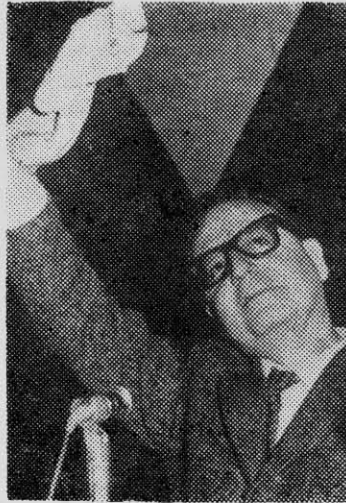
SALVADOR ALLENDE, Presidente de Chile.

La acción provocativa más espectacular fue el intento de asesinato del general René Schneider, Comandante en Jefe del Ejército. La planificación y ejecución de ese atentado revelan en forma clara la participación directa —o entre bastidores— de agentes del imperialismo. En forma casi simultánea se