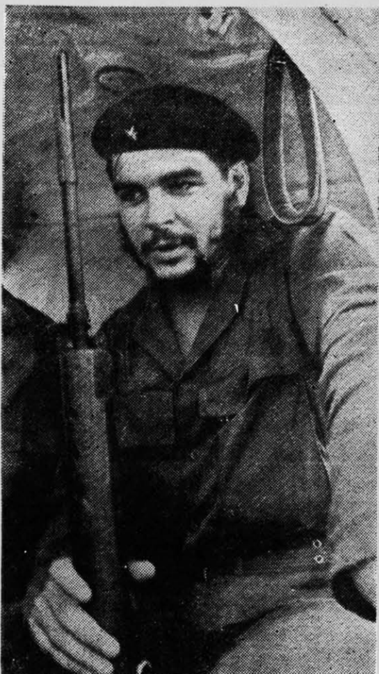
CHE GUEVARA.—Él hombre nuevo que él propugnó se hace realidad en la Cuba Socialista.

No menos cuantiosos fueron los recursos empleados en el transporte. Sólo en materia ferroviaria se adquirieron o fabricaron 600 carros tolvas, 85 locomotoras, 1.250 casillas,