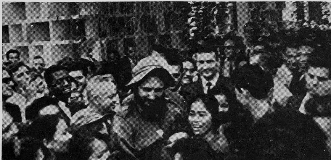
FIDEL CASTRO, Primer Ministro y Primer Secretario del Comité Central del Partido Comunista de Cuba.

una empresa difícilísima. De todas maneras por ahora habrá que cortar caña a mano y mucha más que antes.