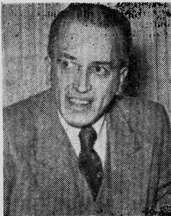
BALTRA: bautizó el programa.

da", bautizado así con toda honestidad por Baltra, es ni más ni menos el Programa de la Unidad Popular de 1970.