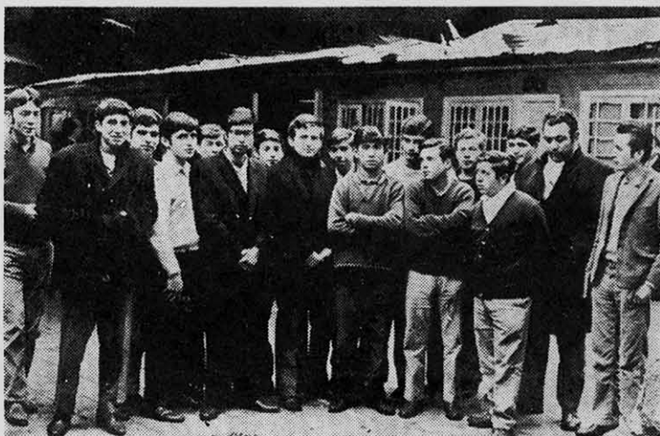
Los obreros de SABA en la cárcel: un ejemplo vivo de persecución burguesa.

El partido proletario, la vanguardia de clase de éste, deberá buscar la forma de