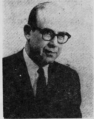
KORRY, embajador yanqui.

un Gobierno burgués como el existente, sus intereses están protegidos.