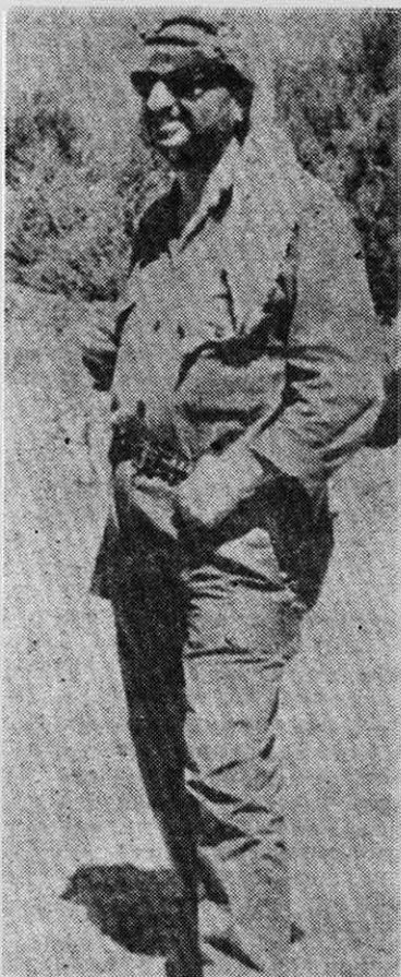
Yasser Arafat, jefe del Al Fatah.

La prueba de que esta zona habrá de ser en la década del 70 un campo neurálgico donde Estados Unidos y la URSS dirimirán su propia supremacía, está dada por la atención que la Casa Blanca y el Kremlin dedican a la misma.