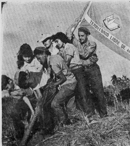
"La zafra de los 10 millones será también un triunfo ideológico".

A las cuatro horas, me sentía morir. Ahí comencé a comprender el significado de las palabras de Fidel, sobre el amor propio, la vergüenza del hombre, y seguí con renovadas energías. Al término de mis cinco primeras horas de cañero improvisado, un cortador viejo calculó mi rendimiento. Seguramente aumentó la cantidad para estimularme. Con ojo profesional miró las pilas de caña que con mi pareja de corte habíamos dejado tras