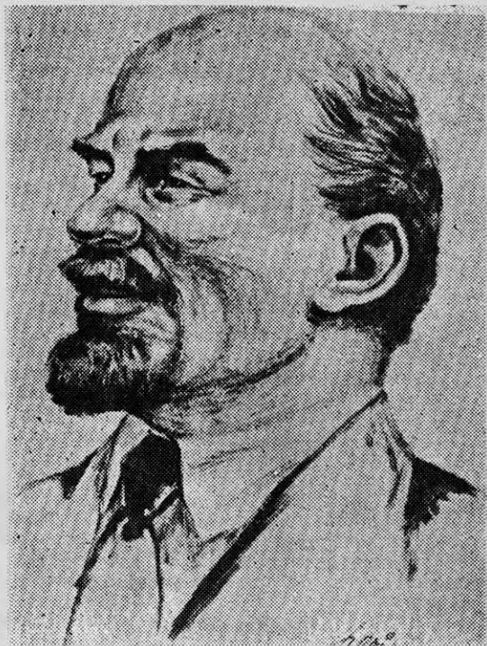
LENIN: el proletariado debe destruir violentamente el Estado de la burguesía.

"Kautsky elogia a los mencheviques porque insistieron en que se mantuviera el ejército en disposición de combate. A los bolcheviques les censura el haber aumentado la "desorganización del ejército". Esto significa elogiar al reformismo y la subordinación a la burguesía imperialista, censurar la revolución y renegar de ella, porque mantener bajo Kerenski la disposición de combate signi-