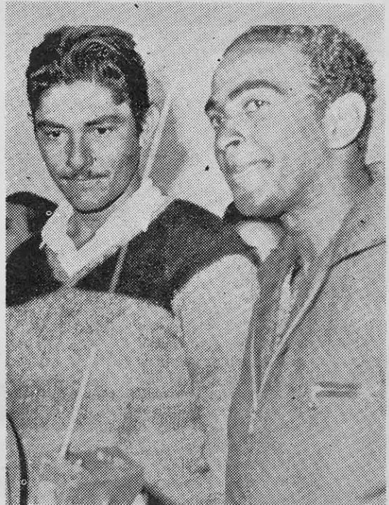
POMBO Y BENIGNO: relatan el último combate del Che en Bolivia.

Pero no sólo se trata de 3 departamentos que son inmensos, sino que entre ellos hay una diferencia enorme de clima y de relieve.