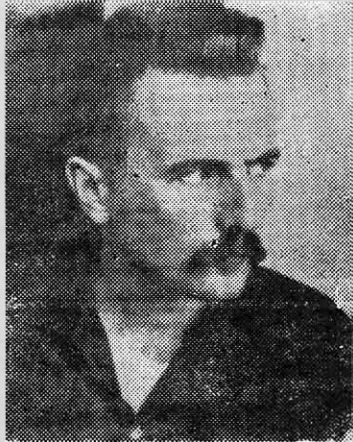
REGIS DEBRAY: es un ejemplo.

¿Hasta dónde podemos contribuir nosotros? Desde luego que si nos limitamos a una labor puramente literaria esa contribución va a ser menor y a mucho más largo plazo. Si yo voy a una guerrilla dirían que me manda el enemigo, porque tendrían que estar mis compañeros preocupados de mis pies pla-