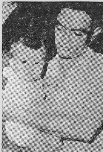
COCO PEREDO: un guerrillero.

Hay otros axiomas en la táctica de guerrillas. El conocimiento del terreno debe ser absoluto. El guerrillero no puede desconocer el lugar donde va a atacar, pero además debe conocer todos los trillos de retirada así como todos los caminos de acceso