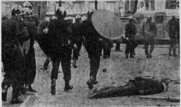
Incidentes de mayo en el Barrio Latino de París: allí comenzó la caída del general De Gaulle.

En el fondo la derrota de De Gaulle y su retiro a un estatus de jubilado representa la victoria de la más conservadora derecha francesa, que si bien mantiene su respeto por el viejo general le