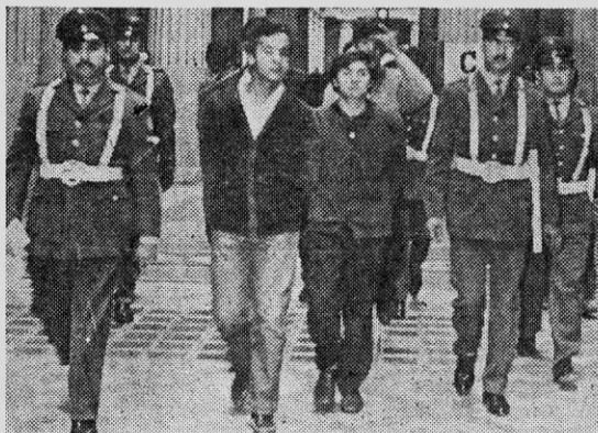
ESTUDIANTES SECUNDARIOS detenidos en las protestas contra el Servicio Militar son llevados a los tribunales.

Si se observa que la edad promedio de los estudiantes de los 5º y 6º años de humanidades fluctúa entre 15 y 18 años se advertirá que una gran masa de adolescentes serán incorporados a nuevos deberes sin disfrutar de nuevos derechos. Para los efectos