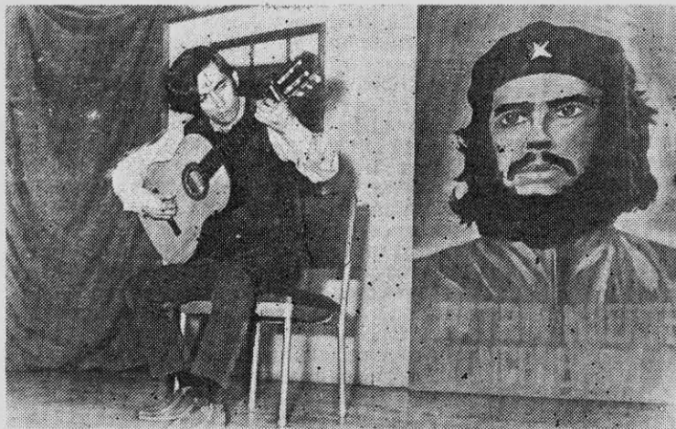
ANGEL PARRA, el afamado folklorista, interviene en el Teatro Municipal de San Miguel, durante el acto solidario con la revista clausurada.