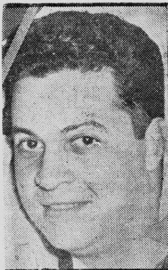
VARAS: lugares poco comunes

alegría el don de José Miguel Varas para apropiarse del lenguaje hablado de los chilenos de distinta clase social e, incluso, de diferentes oficios.