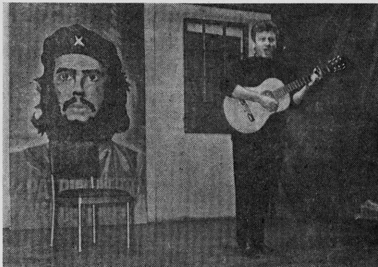
PATRICIO MANNS, una de las más conocidas voces rebeldes de la canción chilena, canta en el festival con que los artistas apoyaron a PUNTO FINAL.

Los sindicatos Profesional e Industrial de Chilectra entregaron la siguiente declaración: