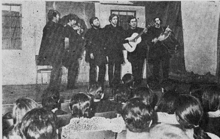
EL CONJUNTO "Quilapayún", durante su presentación en el festival artístico de solidaridad con PUNTO FINAL.