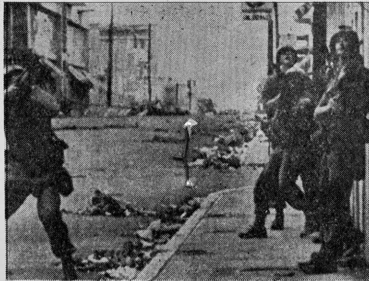
Marines aplican táctica de contrainsurgencia en las calles de Santo Domingo.

CRESS es responsable de las investigaciones sociales referentes a problemas militares, incluyendo contrainsurgencia, acción civica-militar, guerra psicológica y ayuda militar norteamericana