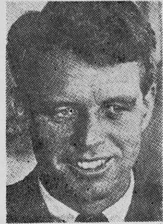
ROBERT KENNEDY: Justificación tardía

G) El triste papel de la OEA, cuyo lacayismo llegó a sorprender a los propios norteamericanos, quienes necesi-