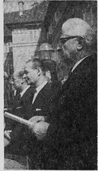
SVOBODA Y DUBCHEK

Ese mismo documento señaló en esa ocasión que "sabemos que los imperialistas —particularmente los reaccionarios de Bonn— se han esforzado por dar su apoyo a las fuerzas hostiles al socialismo en Checoslovaquia", agregando que "sin minimizar el peligro que representan sus pretensiones revanchistas, difícilmente se puede creer que Checoslovaquia estaba a punto de sufrir una agresión militar". El comunicado oficial de ahora, en cambio, pone su acento en "la