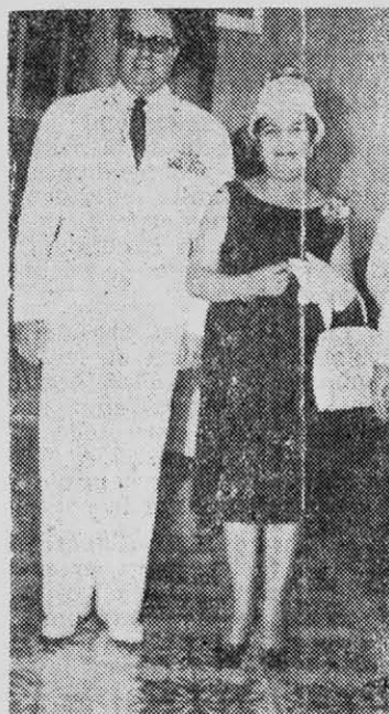
"Tachito" Somoza: dinastía de tiranos

Apartando lo que pudiera haber de imaginación poética en esa historia, es evidente que había allí una presencia demoníaca; porque dondequiera que hay violencia, crueldad, odio a la vida, está el Demonio: ese "homicida desde el principio", según dijo Cristo en el Evangelio de San Juan. El Demonio también ha estado presente en este crimen — que por cierto no es el único de su especie habido en los últimos 30 años y pico. Y el hecho de que ha-