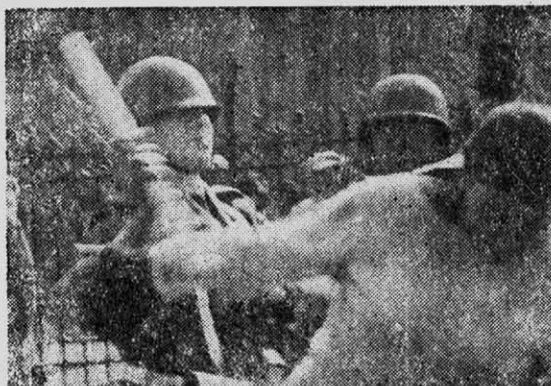
“Palos en libertad”

Otro tema que ocupa un espacio importante en este número se refiere al desarrollo del Quinto Congreso de la CUT y al mencionarlo es forzoso recordar un hecho paralelo a él que representa otra manifestación del carácter represivo del actual gobierno, el que no es debidamente denunciado por las fuerzas situadas en la trinchera que se define como revolucionaria.