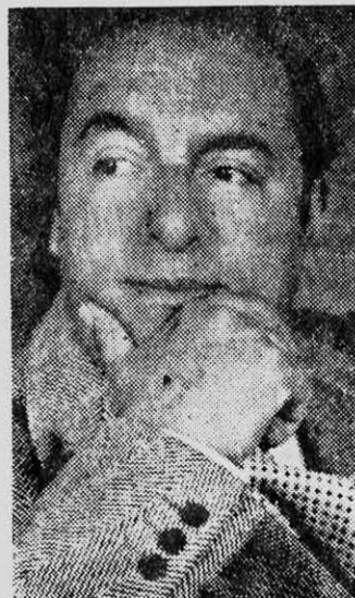
Neruda: postales en "Ercilla"

Una sombra espesa se ha apoderado de muchos intelectuales de "izquierda": el miedo. Un miedo indecible a asumir su condición de artistas y factores de cultura, de ejercer la saludable dignidad crítica. Algunos confiesan: "Qué quieres, si prescindes de Zig-Zag y El Mercurio, sólo te queda el P.C. Si te atreves a criticar algún gesto del partido, entonces te conviertes en un paria en Chile". Una matonesca presión ambidextra se cierne sobre estos intelectuales, lo que explica, pero no justifica su resignación. La autocensura se introduce por dos canales como también la compulsión hacia el arrodillamiento. El resultado es una "literatura" legal y sin subversión, un "saludo a la bandera" a dos manos. ¿Y el pueblo? Bien, gracias. ¿Qué ejemplo recibe la nueva generación de los viejos consagrados? En circunstancias que hasta Fischer, Aragón y Garaudy se rebelan contra la "recaída en el stalinismo" y los estudiantes europeos desafían las "sociedades de consumo" embanderados con la efígie del Che Guevara, Nicanor Parra escribe "Cuba sí y yanquis también", renuncia en inglés a su cátedra universitaria en desacuerdo con el simple planteo de co-gobierno estudiantil, exclama "juntos sí pero no revueltos" —contradiendo aquellos versos paupérrimos— y se marcha a USA contratado en dólares. Neruda persiste en admitir el jadeo por el premio Nóbel, que rechazara Pasternak, lapidara Sartre y aceptara ufano "el realista-socialista" Sholoyov.