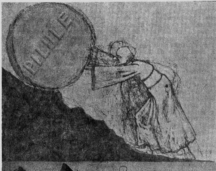
LA PILDORA DE SISIFO, caricatura de TIM en L'EXPRESS.

Por otro lado la intervención directa del Partido Comunista francés impidió a Sauvageot asistir al Festival Mundial de la Juventud realizado en Bulgaria. La invitación fue retenida por los búlgaros a petición del comité central del PCF.