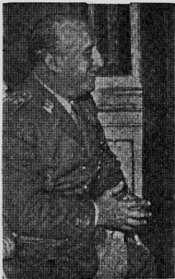
FRANCO: se activa el movimiento obrero.

Hoy en día, merced a la propaganda y a la constante agitación en los medios obreros, estas organizaciones, las Comisiones Obre-