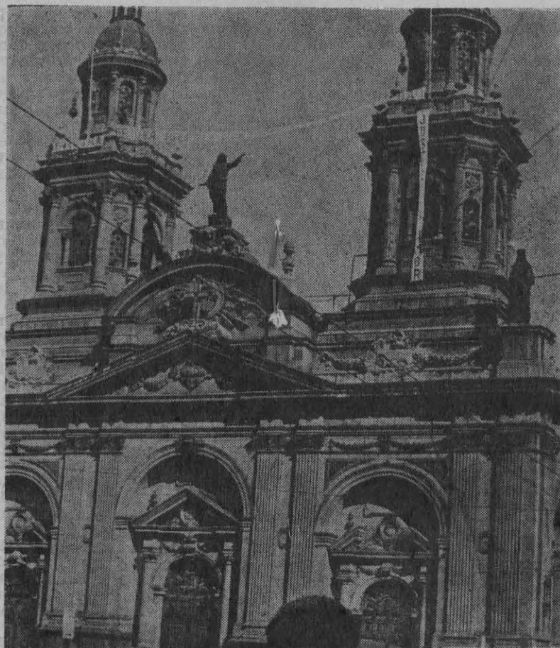
LA CATEDRAL de Santiago en poder de los "rebeldes" cristianos.

Los verdaderos profanadores del templo de Dios son todos aquellos que entran a él con la bolsa bien llena de escudos y de