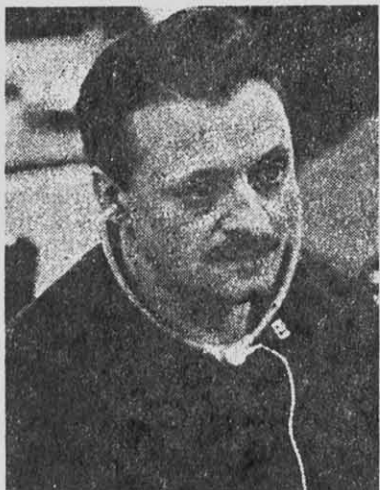
MARIO BENEDETTI: "En América Latina los políticos se han corrompido..."

temente sensible a los clamores, pero en realidad desentendida de un auditorio que, en el mejor de los casos, bosteza, y, en el peor, se muere de hambre. El político profesional, aunque todavía conserva el poder, ha perdido el papel de orientador".