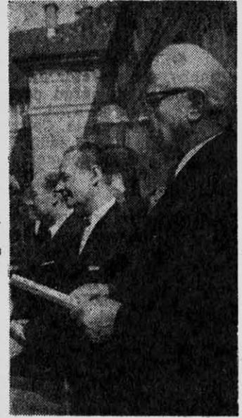
LUDVIK SVOBODA, Presidente de Checoslovaquia. A su lado, A. Dubcek, secretario general del PC.

Antes fue Hungría y ahora Checoslovaquia. En ambos casos, los partidos comunistas copiaron mecánicamente el socialismo soviético desde el punto de vista económico, y en el plano social dejaron de mano la democracia socialista, creando un natural anticuerpo.