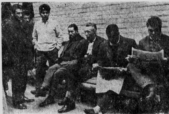
CAMPESINOS presos en la cárcel de Valparaíso.