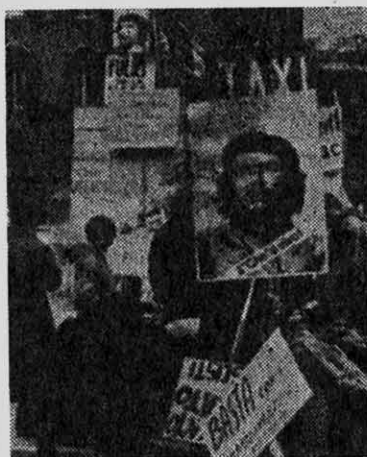
CHE GUEVARA: los amigos falsos y los verdaderos.