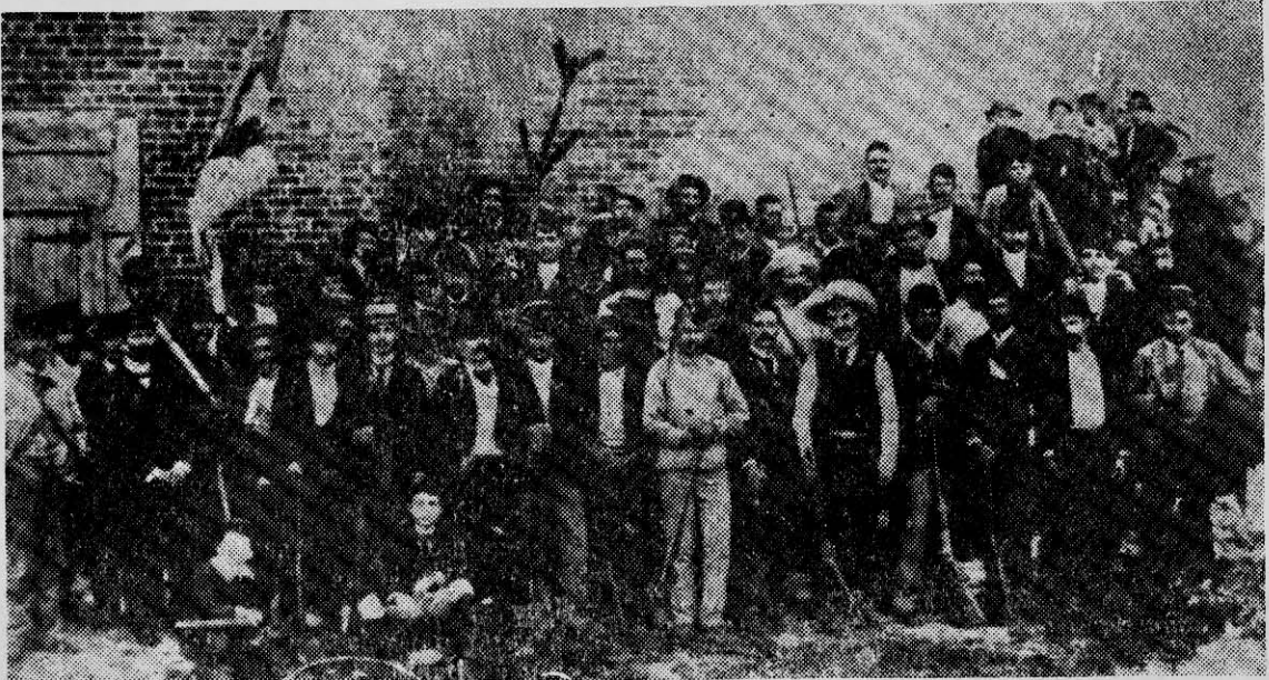
TABAQUEROS cubanos de Tampa, Florida, adiestrándose en el manejo de armas para liberar a su patria del yugo colonial.

fuerza la elección de diputados en la colonia cubana, pero ello durará poco. Convencidos de que alentar la reforma es perder la isla a largo plazo, los dirigentes españoles expulsan a los diputados cubanos de las Cortes (21).