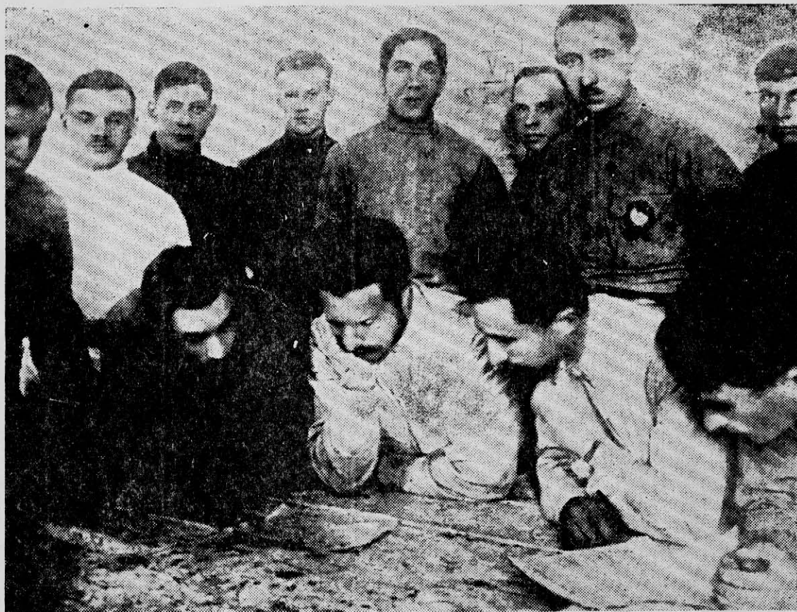
LOS DIRIGENTES militares de la revolución de Octubre trazan los planes de la insurrección que llevó a la clase obrera al poder en la URSS.

do estudiemos los diferentes elementos que caracterizan la organización y la ejecución de la sublevación armada.