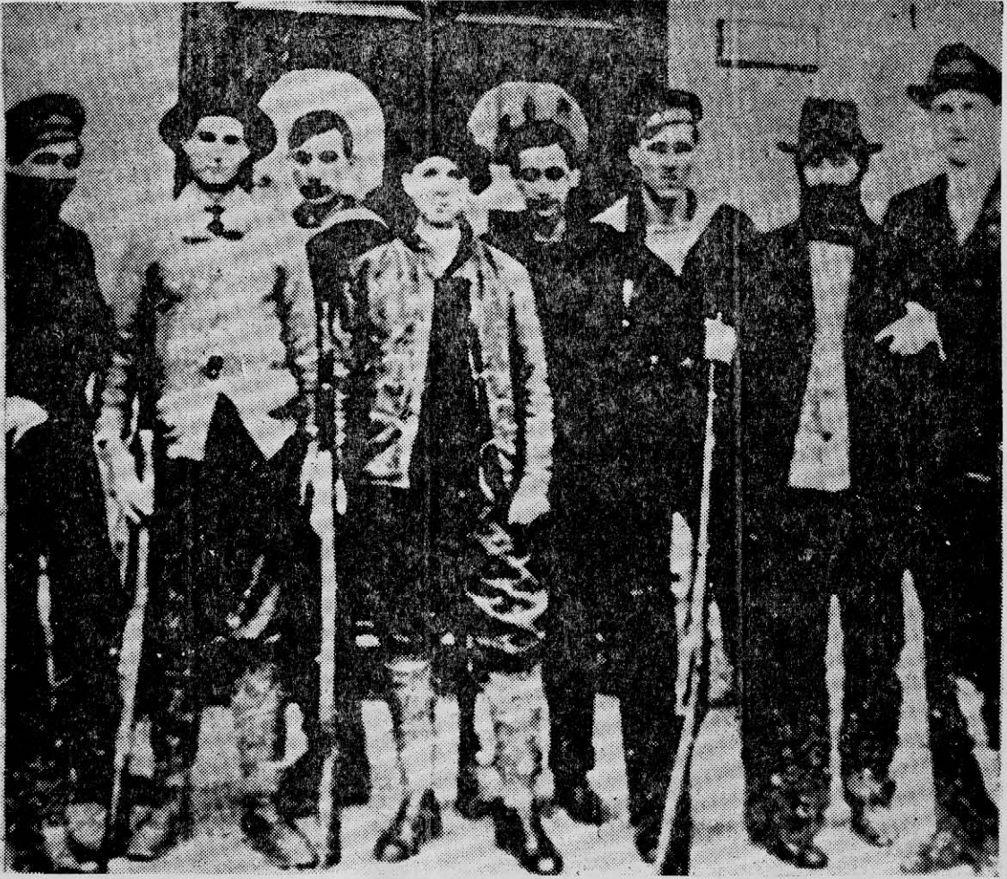
OBREROS, soldados y marineros armados dieron sólido respaldo a los bolcheviques cuando en 1917, bajo la dirección de Lenin, conquistaron el poder.

la causa del proletariado revolucionario o, al menos, para neutralizarlas. El Partido y el proletariado deben dedicar la mayor atención a esta tarea.