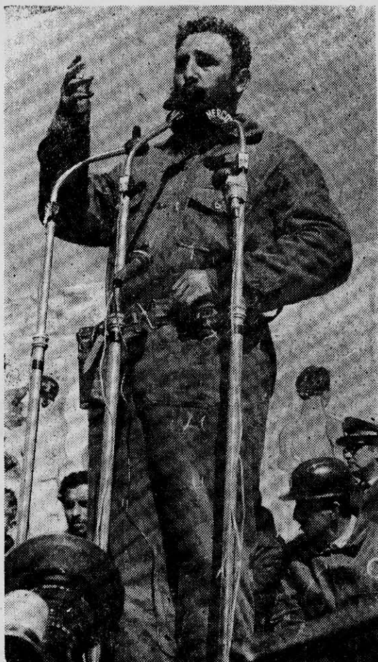
FIDEL CASTRO: cien años después, en 1953, continuó la revolución de Martí.

Como medios para tales fines usó tres: sus discursos, sus artículos periodísticos y su correspondencia. Si tenemos en cuenta que vivió 42 años asombra ver que sus obras completas constan de 27 volúmenes de unas 500 páginas cada uno como promedio. Cabe preguntarse cómo tuvo tiempo para algo, además de escribir. Y es que —como