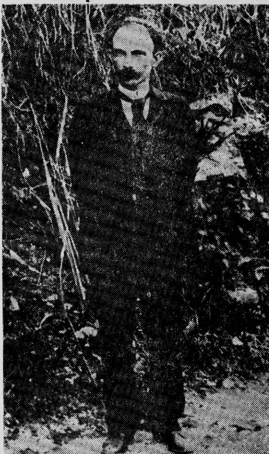
JOSE MARTI: el Apóstol de la independencia de Cuba fue también un esforzado organizador revolucionario.

☆ PUNTO FINAL solicitó al escritor cubano Lisandro Otero, el artículo que se reproduce a continuación. Próximo a cumplirse el vigésimo aniversario del Asalto al Cuartel Moncada, que abre en América latina la ruta hacia la conquista revolucionaria del poder, conviene verificar los orígenes más profundos de la revolución cubana. Entre ellos está la gesta de Martí que influenció fuertemente a la llamada Generación del Centenario, encabezada por Fidel Castro. En este trabajo, Lisandro Otero analiza, precisamente, un ángulo de la lucha de José Martí al que suele darse poca importancia: su rol como organizador revolucionario, cuyos objetivos se vieron concretados en la primera revolución socialista de nuestro continente.