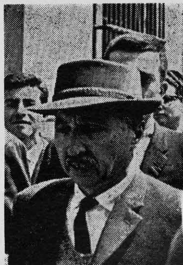
LUIS CORVALAN: las consecuencias del sectarismo

Todos los partidos han cometido errores y han sido víctimas de desviaciones que sólo el proceso revolucionario va a corregir totalmente. Si no cargáramos con la herencia de errores que nos dejó la práctica política del pasado, si no existieran discrepancias ideológicas que todavía no han perdido validez, no existiría ningún problema para que la izquierda se agrupara en un solo y gran partido revolucionario. Estamos seguros que eso llegará en