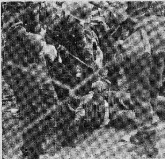
El Grupo Móvil, entrenado por EE. UU., fue el instrumento represivo del gobierno de Frei.

Los mismos asesores de la OASP aparecieron también dando cursos en la técnica del control de muchedumbres, cuando se retiraron los infantes de marina que invadieron la República Dominicana. La OASP plantea que su asistencia policial "no está apoyando las dictaduras" pero esta sutileza resulta desmentida cuando uno de sus administradores, David Bell, compareciendo ante la Comisión del Senado norteamericano en 1965, dijo que "no es obviamente nuestro objetivo el asesorar a un estado que sea represivo; lo que pasa es que