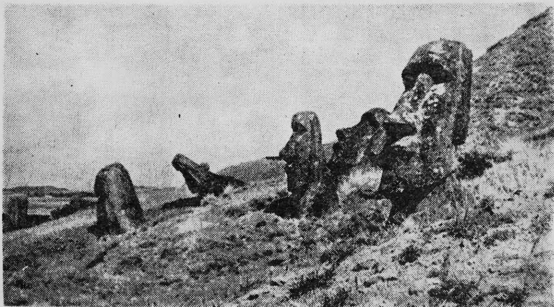
ISLA DE PASCUA: los yanquis arrasaron con la cultura propia de esa posesión chilena en el Pacífico.

norteamericana Lindblad Travel, la que —por extraña coincidencia— abandonó también la isla después del 4 de septiembre.