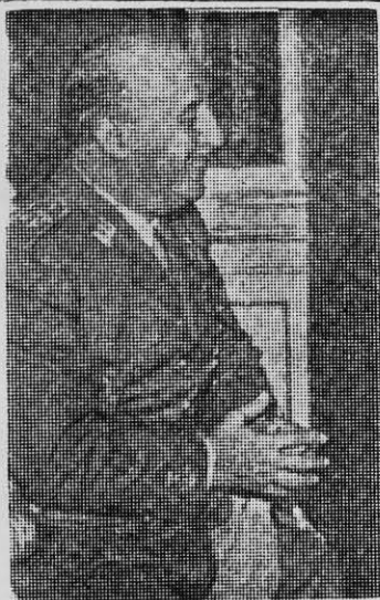
FRANCISCO FRANCO: lo desafían revolucionarios vascos.

★ La vida del cónsul de Alemania Federal en San Sebastián (España) dependía —al cierre de esta edición— de la suerte que corrieran 16 revolucionarios vascos.