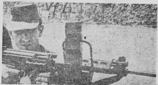
CARLOS LAMARCA: la lucha guerrillera.

Nuestro pueblo no tiene, en consecuencia, nada que esperar de las clases dominantes, que se presentan bajo las banderas de la libertad, las tradiciones populares y el interés nacional. La violencia organizada de las masas populares es así la única salida que deja abierta la violencia oficial. Es la perspectiva de una guerra del pueblo, larga y difícil.