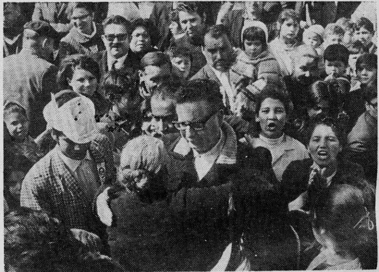
HAY QUE FORTALECER la presencia proletaria dentro de la Unidad Popular.

Pensamos que la política de frente llevada a cabo por la Unidad Popular ha sido correcta en sus grandes líneas, que ella ha sabido detectar en forma correcta al enemigo principal de este momento: los grandes terratenientes, el capital monopolista industrial y bancario y el imperialismo. Que para derrotar a este medio tan poderoso era necesario aislarlo esforzándose por unificar en un mismo frente a todas las fuerzas sociales que po-