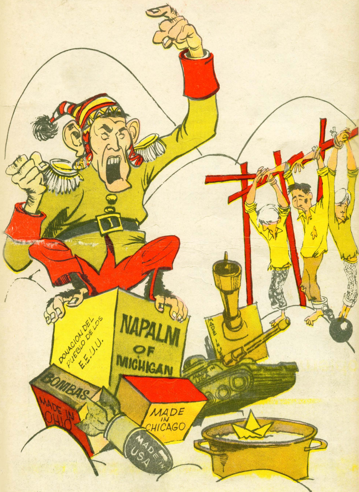
BARRIENTOS: Condenaremos a Debray porque no aceptamos intromisión extranjera en Bolivia.