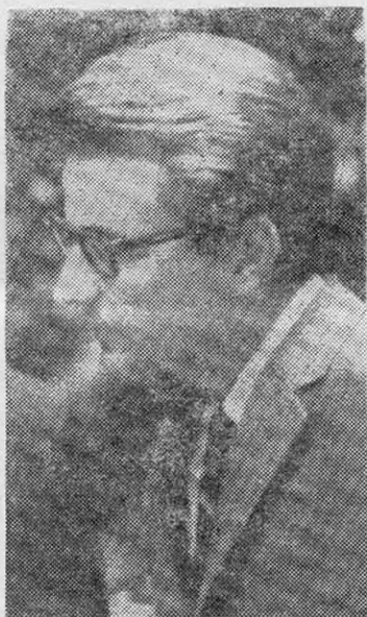
DEBRAY: Solidaridad mundial