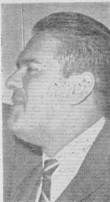
HURTADO: Asamblea continental.

Y como un símbolo y una realidad que señala el método correcto, el único posible para que el poder sea de ver-