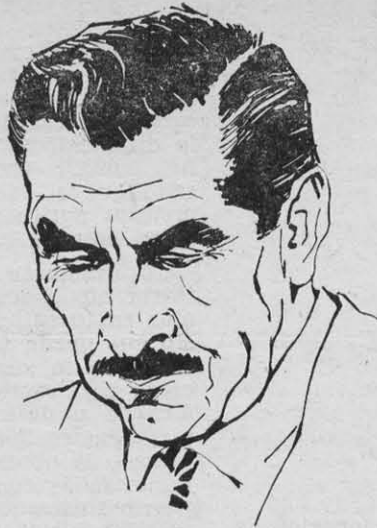
CARMONA: le dio el "conforme" al coronel Pinochet

¿Por qué ha ocurrido esto? Porque el movimiento sindical