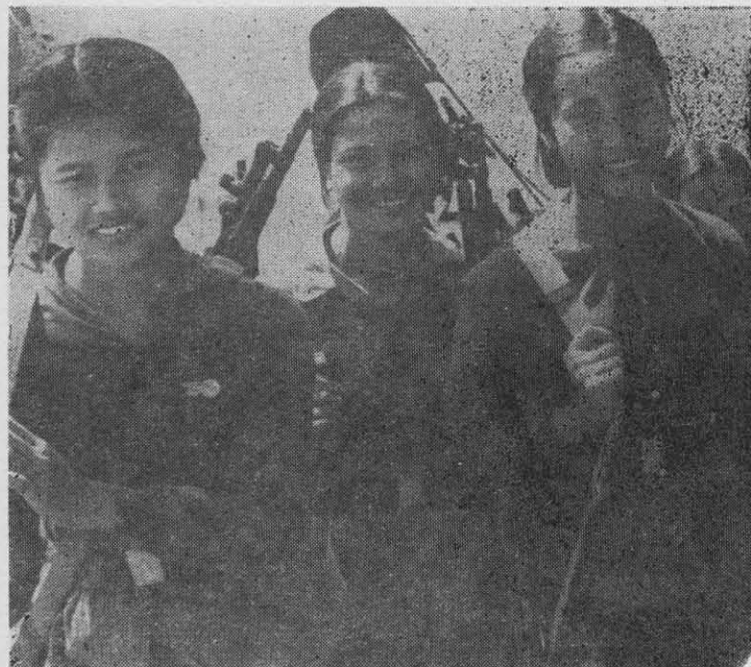
Están cambiando el fusil por los cohetes.

de la riquísima familia Rockefeller y, entre otras cosas, presidente del Chase Manhattan Bank —uno de los principales bancos norteamericanos—, además de controlar poderosos intereses en todos los sectores industriales y financieros de EE. UU., particularmente en los petroleros. La Standard Oil (Esso) pertenece a la familia Rockefeller.