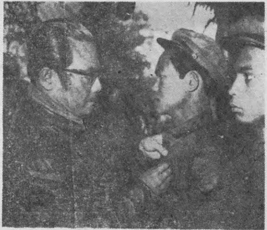
El Príncipe Shuophanouvong, líder máximo del Neo Lao Haksat, condecora a uno de los jóvenes soldados de la resistencia.

Esta última perspectiva disgustó a los imperialistas norteamericanos, que desde 1951 estaban interviniendo en Laos. Desde entonces hasta hoy, han realizado toda clase de maniobras para dividir a Laos y destruir el Gobierno Nacional Tripartito que se formó